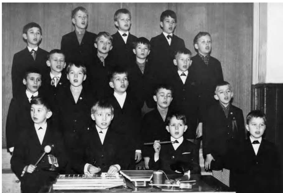
Esimene poistekoori klass, arvatavasti 1969. aasta kevadel. Eve Mikkori kogust.