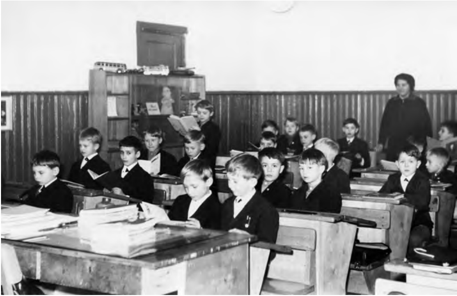
Sellised nägid välja klassiruumid 1969. aastal. Pildil arvatavasti esimene poistekoori klass.

Kümnendi keskpaigaks olid olemas ka algklasside, eesti keele ja matemaatika kabinetid ning nüüd võidi juba hakata kabinette omavahel võrdlema, nii kooli sees kui ka üle linna. 1975. aastal leiti parim olevat algklasside kabinet (õp Neem), mis saavutas ülelinnalisel ülevaatusel kolmanda koha.